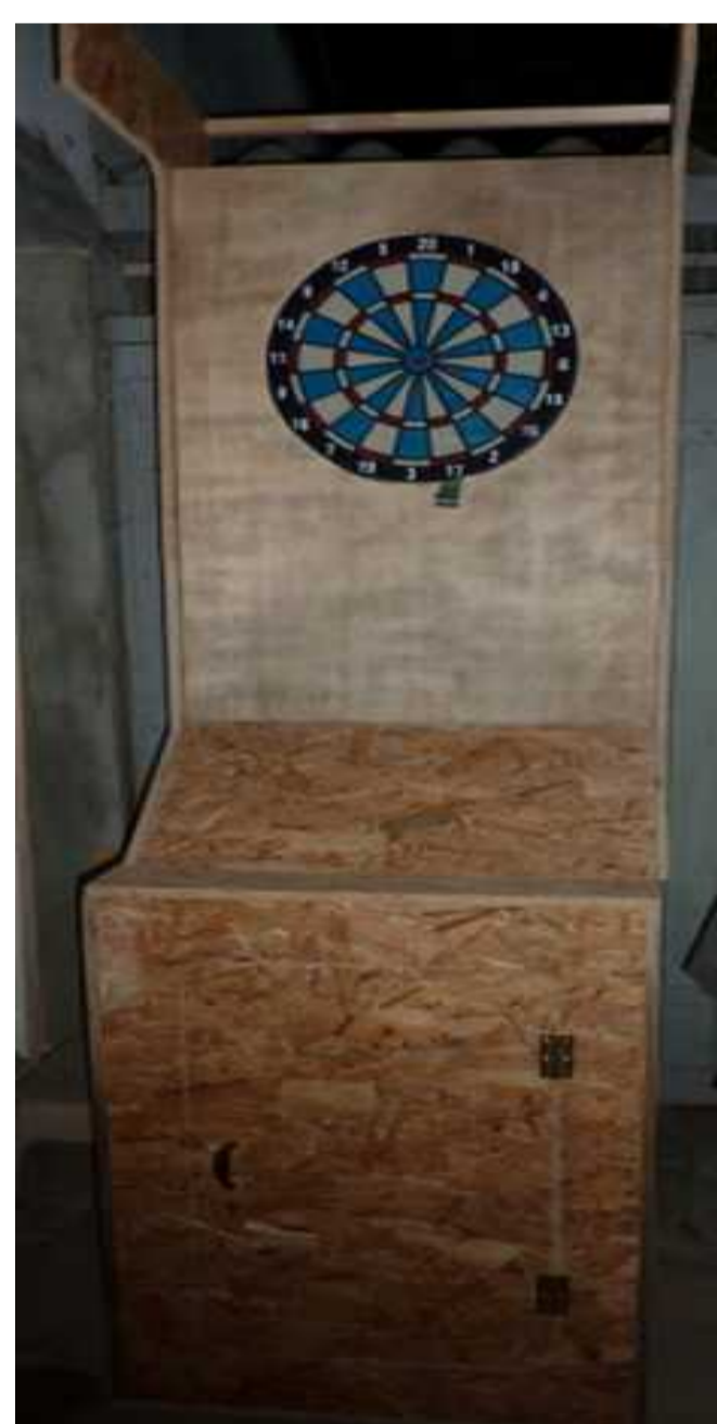
Un jeu de fléchette électronique maison

Les règles sont programmables. c'est le développeur qui gagne ☺