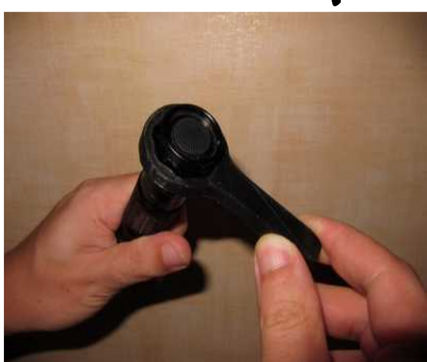
Une clé sur mesure.